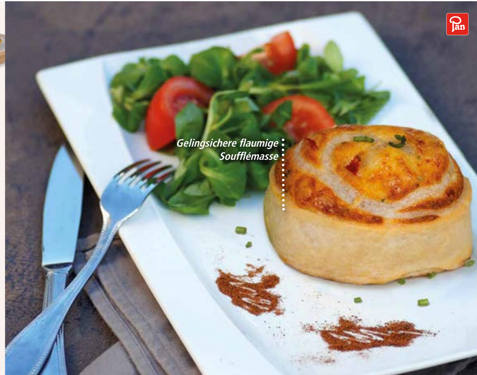
Gelingsichere flaumige Soufflémasse

Serviertipp: Spinatstrudel-Schnitte mit Tomatensauce, Parmesanhippe und Basilikum